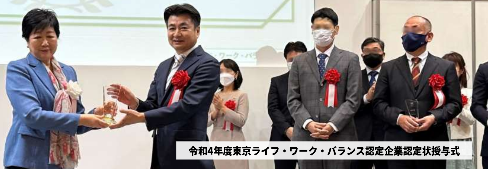
令和4年度東京ライフ・ワーク・バランス認定企業認定状授与式