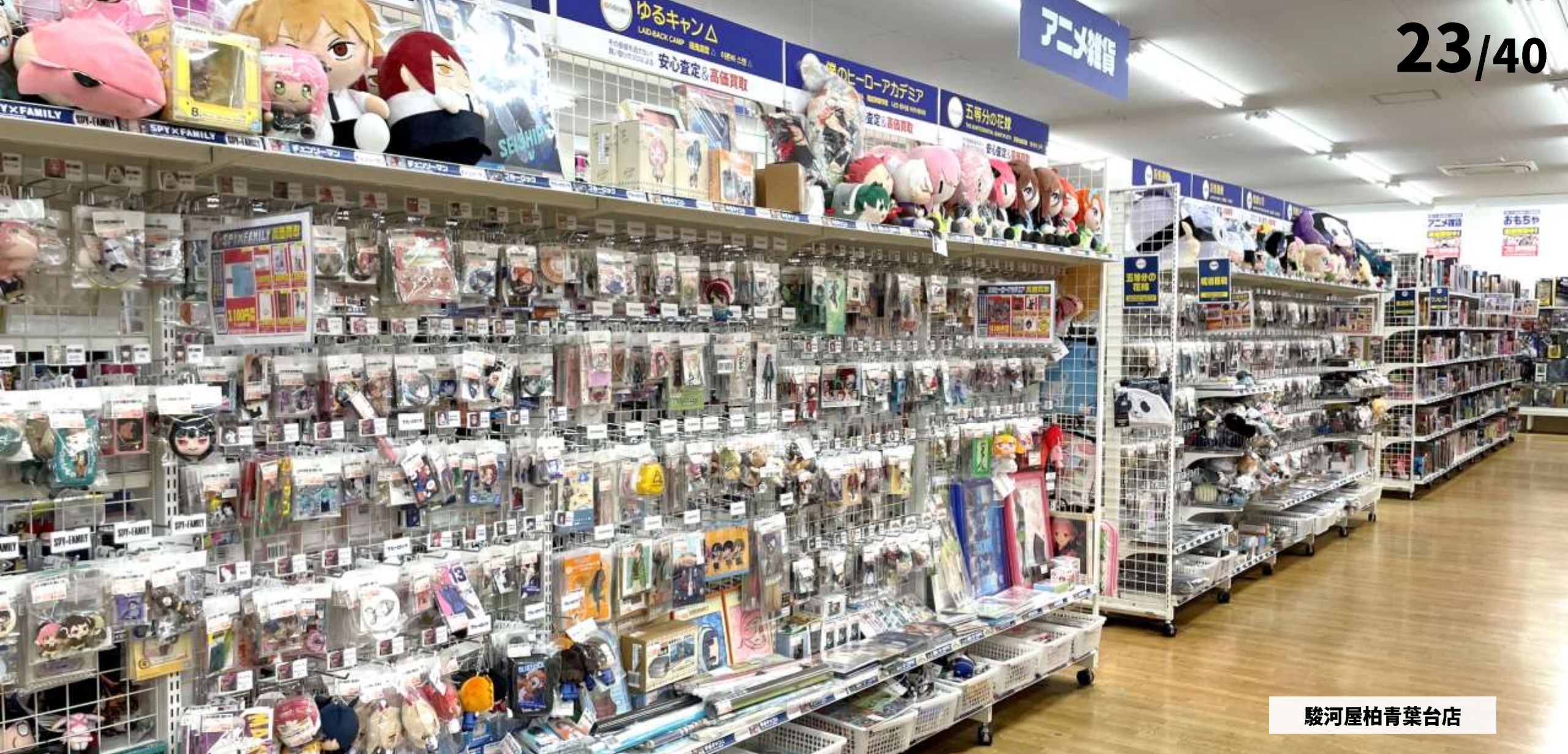
駿河屋柏青葉台店