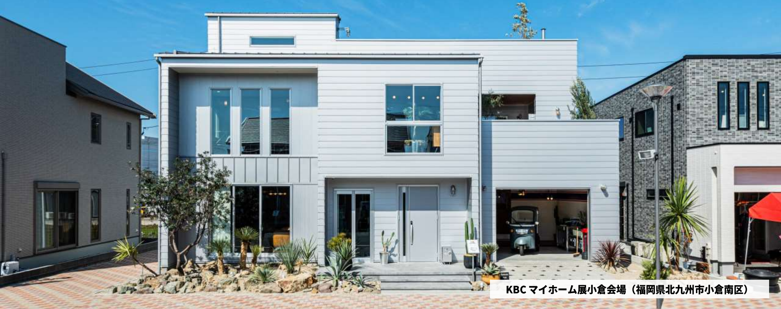
KBC マイホーム展小倉会場（福岡県北九州市小倉南区）